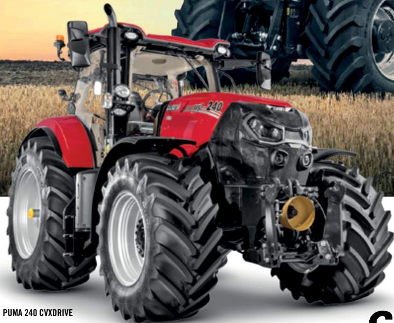
PUMA 240 CVXDRIVE

Gennemtestet produkt (Puma 240 CVX mest solgte model i DK i 2019 & 2020)