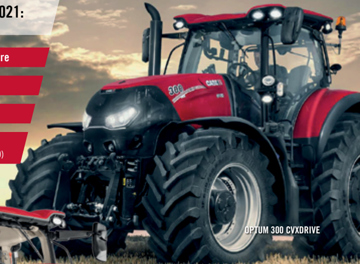
OPTUM 300 CVXDRIVE